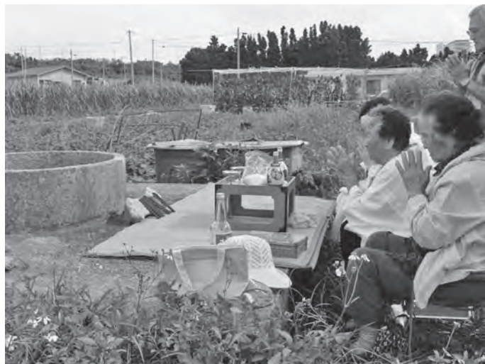
写真2 ニーガーで拝む（2015年ハ一拝み）

めているという作業服姿の男性が神人たちの後ろで一緒に手を合わせていた（写真3）。