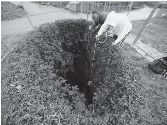
写真1 シリガーでの若水汲み（2012年旧正月）