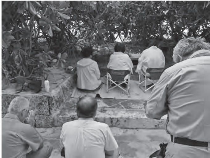
写真3 パマガーで拝む（2013年ハー拝み）