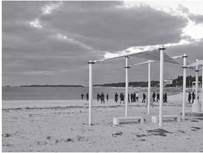
写真5 エグビーチでのミジナリー（2016年12月）

このミジナリーの儀礼では、参列者はまず潮水を浴び、それからパマガーの水を浴びる。この水は山から流れてきたものだから、人びとは海の水と山の水を浴びることになる。まず引く潮とともに災厄が祓われるようにと潮水を浴び、そして湧水で身を清める 22 。この二重の清めには、身内の死という難事を乗り越えて新たな人生を歩み出せるようにとの願いが込められているように感じられる。つまりここでも、浜辺の湧水に生まれ変わりをうながす力をみている。山手に降った雨水が地下の水脈となって流れ下り、グソーの浜辺で山の葉とともに湧き出す。その姿に、再生の力を感じとったのはごく自然なことだったのかもしれない。