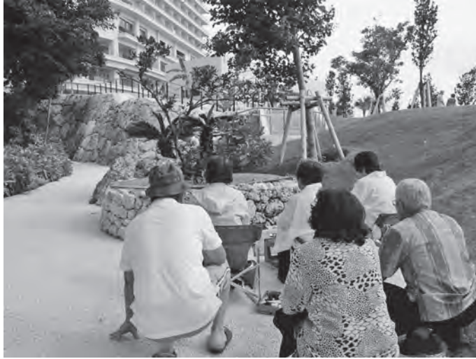
写真4 整備されたウイガーで拝む（2015年ハーパー）

体的な場所は示されなかったが、おおそガンヤーガマ辺りとみなしているようだ。かつて水汲みに行く子どもたちが死者の影を感じて足早に通り過ぎたこのガンヤーの周辺も、ホテルの建設に伴い、その影はだいぶ薄くなった。