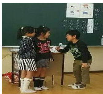
<②インタビューの様子>