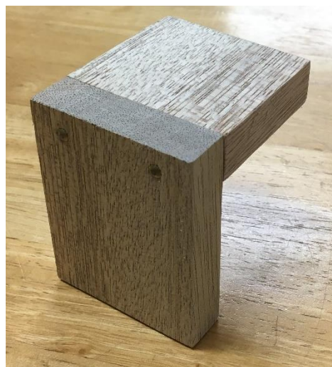
図2 導入教材の完成見本