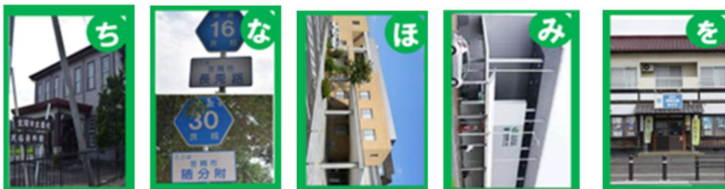
図3 絵札の例 6)

なお、地域かるたの札内容の場所を示した市の地図も制作した（図4参照）。基となる地図は、市の教育委員会から笠間市副読本に添付されている笠間市全図データの提供を受け、駅や小・中学校、警察署、消防署、隣接する市町村などを書き込んだ。また、地図上に場所を表すことができる札を選別し、シールに札の頭文字を書き地図に添付した。地域かるたと地図を併用することで、それぞれの場所を確かめることによって、それぞれの位置関係を把握したり、関連を考察したりすることもできる。検証授業でのかるた取りの際は、模造紙大に拡大した地図を各グループに配付した。